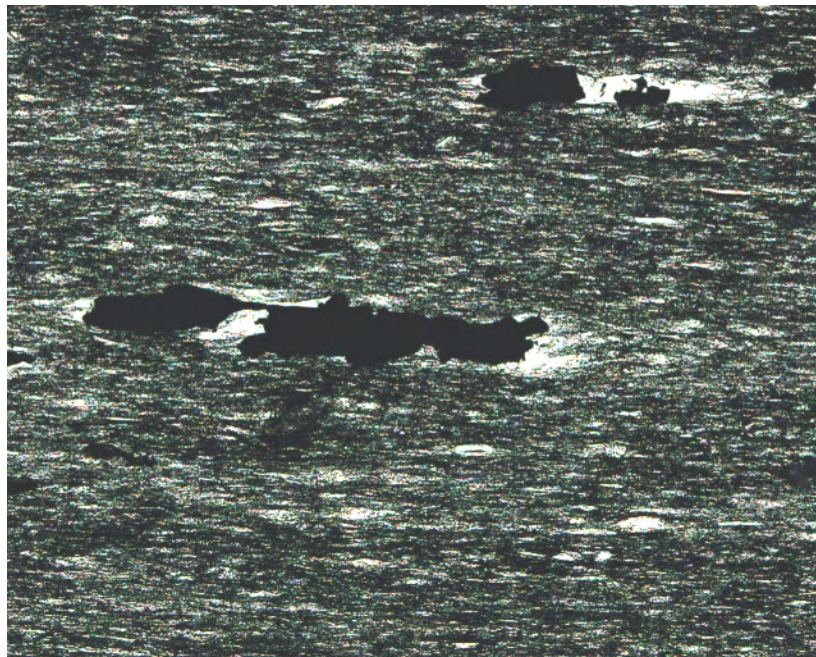
Dünnschliffaufnahme, ca. 40 fach, einfach polarisiert

Prüfmaterial: MaSpana-Schiefer, Grube C 95